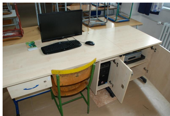
Učebna češtiny s plazmou (č. 207)