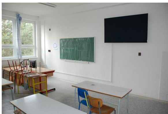
Učebna č. 301

V roce 2013 byl realizován jeden hlavní projekt: vybavení učebny č. 301 pro výuku druhých cizích jazyků projekční technikou . Učebna byla dle žádosti učitelů vybavena projekční technikou s plazmou. Dále byly pro přípravu práce s interaktivní tabulí v kabinetě angličtiny č. 311 ve 3. patře a v kabinetě lektorů B 100 vyměněny počítače za výkonnější.