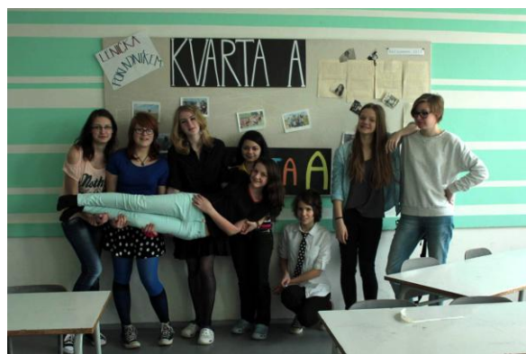
Výzdoba a vybavení třídy č. 300