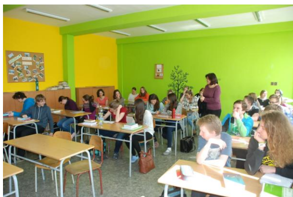
Limetka a citrón – malování třídy č. 204